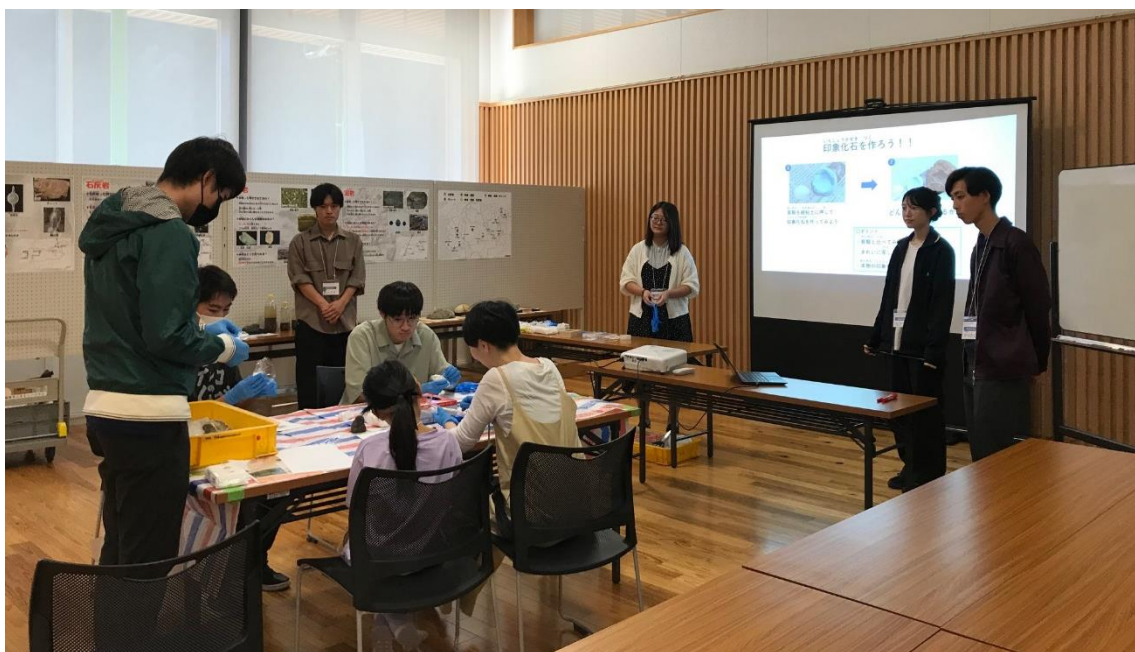
コラボイベントの様子